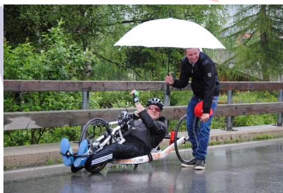
Barre omstandigheden tijdens de training naar het stuwmeer

Oud-revalidanten van Nederlandse revalidatiecentra (Maartenskliniek, Heliomare, Adelante, Het Roessingh, de Hoogstraat, UMCG, Reade, Vogellanden en Rijndam) en een Noors revalidatiecentrum meldden zich aan. Daarnaast deden op individuele basis Oostenrijkers en Belgen mee. Op zondag 14 juni arriveerde iedereen in hotel Weisseespitze, een volledig