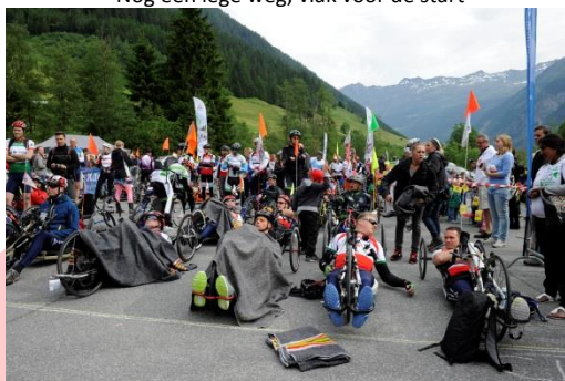
Klaar voor de start