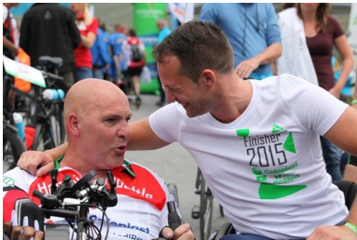
De finish bereikt!