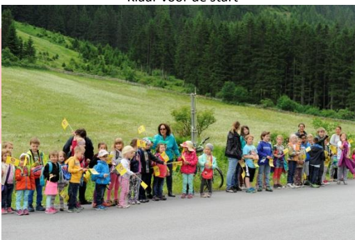
Toegejuicht door de plaatselijke schoolkinderen