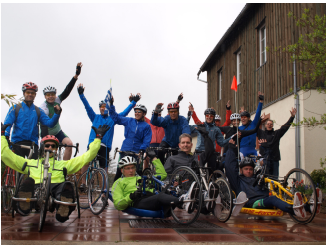
Rijndam Racers trotseren regen en kou in de Ardennen

Je kunt de Rijndam Racers volgen via twitter: http://twitter.com/RijndamRacers . Zo blijf je op de hoogte van de nieuwste ontwikkelingen. Regelmatig sturen we een tweet (een berichtje) de wereld in.